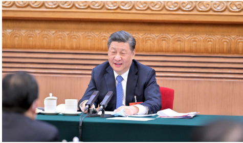
▲习近平总书记在两会

1、审议政府工作报告：先是对2021年度政府工作进行回顾，涉及年生产总值金额、就业民生、居民消费、乡村振兴等。然后再对2022年重点工作进行安排，包括国内生产总值增长率、居民收入稳步增长、粮食产量，乡村振兴仍然是工作重点。