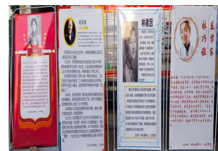
▲杰出女性海报展活动图

这些优秀女性的毅力与精神不禁让人想到三月校园里盛开的白玉兰。白玉兰有着玉的质地跟高雅，它高高的绽放在枝头上，无需绿叶，只是一朵朵白的有些清透的花瓣，在春阳下是如此的轻巧而又美好。正如这些女性不骄不躁从不宜扬自己的美德，她们安静的盛开、优雅地绽放，在留下满园芬芳后又悄悄地离开。时代在变化，人的观念也要与时俱进，新世纪的宏伟大业，为广大女性提供了施展才华的广阔舞台。新时代的女性要进一步树立自尊、自信、自立、自强的精神。在新形势和新任务面前应坚持解放思想、实事求是、勇于创新、开拓进取。在经济和社会发展中大显身手，在实现自身价值的同时创造出无愧于时代的新业绩。我们作为女性感到骄傲和自豪，在我们的前后，在我们的周围有着无数榜样，不断激励我们在新时代的浪潮中奋发进取，努力为新时代做出贡献。