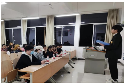
▲分享实践经历与心得体会